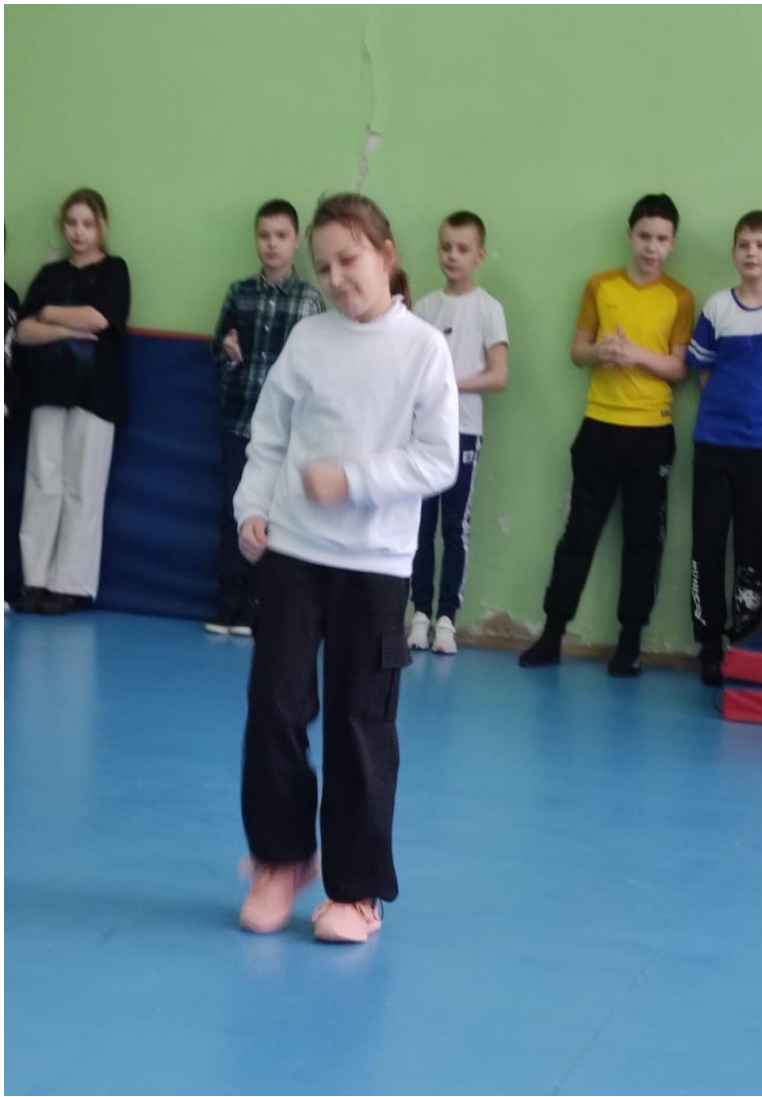
Задорный танец «Яблочко».