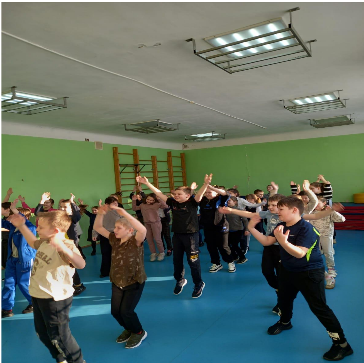
Прошли весёлые старты для мальчиков 2а, 2б и 3 классов.